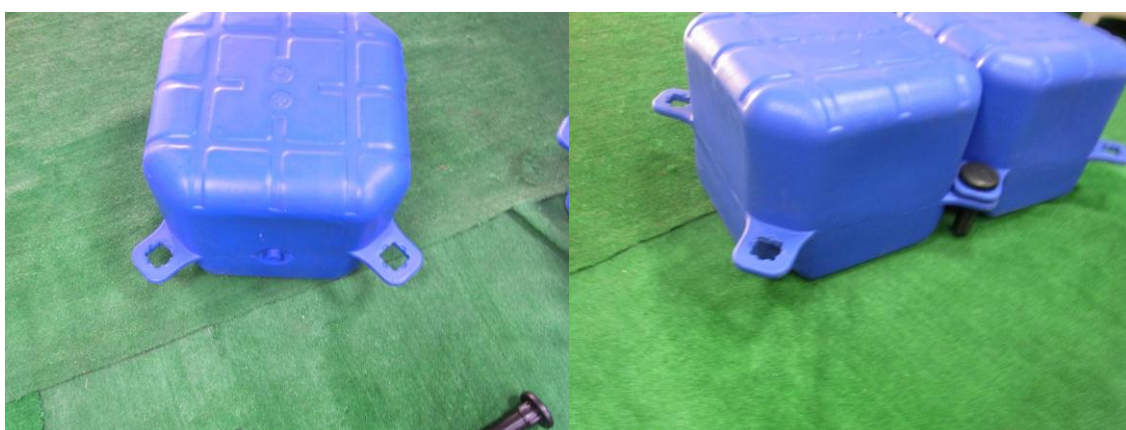
1 個当たりの寸法：50×50×40 cm、重量 7.1kg 特別価格 1 個3万円（税別、運賃込）